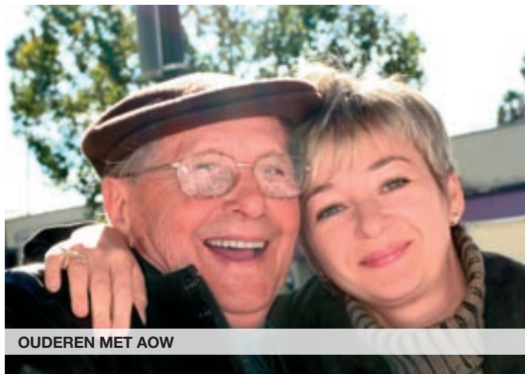
OUDEREN MET AOW